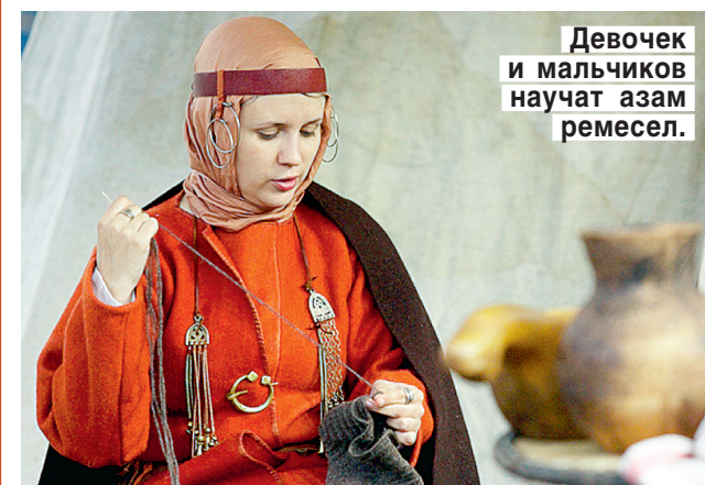
Девочек и мальчиков научат азам ремесел.

Музей викингов в Борге (Лофонтенские острова), открытый в 1995 году, — это реконструированная деревня викингов. История музея началась с того, что во время археологических раскопок на этом месте было найдено крупное жилище конунга викингов. Всего в железном веке в северной Норвегии существовало 10 — 15 поселений викингов.