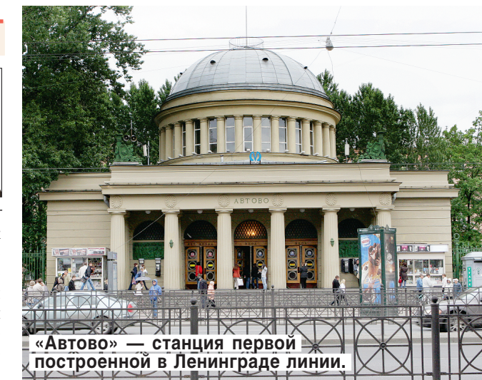
«Автов» — станция первой построенной в Ленинграде линии.

Самая глубокая станция — «Парк Победы» — 84 м. Самая неглубокая — «Печатники» — 5 метров. Самый короткий перегон — «Выставочная» — «Международная» — 500 м.