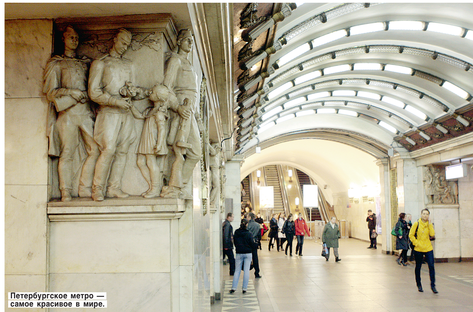
Петербургское метро — самое красивое в мире.