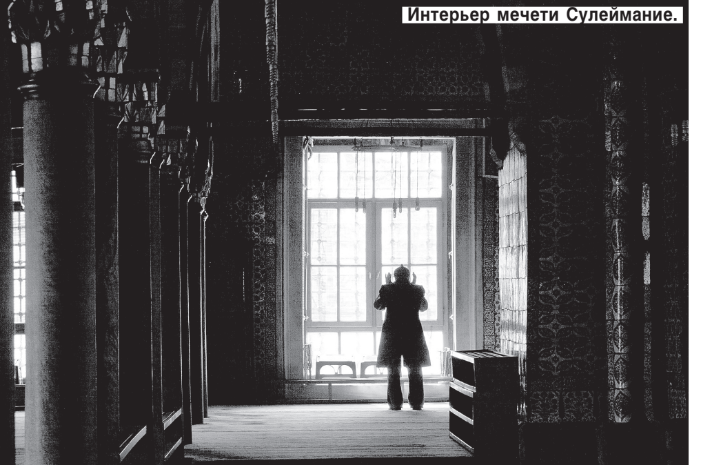
Интерьер мечети Сулеймание.

Бродский сразу хотел уехать из Стамбула. Но не мог, потому что тогда нарушил бы обещание, которое дал самому себе, покидая Петербург: объехать все города, расположенные на той же широте и долготе — на Пул-