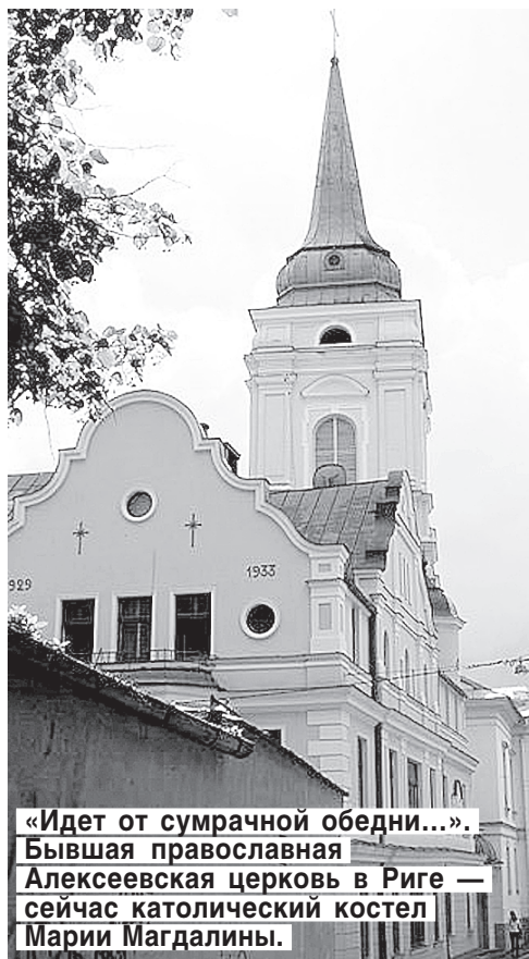
«Идет от сумрачной обедни...». Бывшая православная Алексеевская церковь в Риге — сейчас католический костел Марии Магдалины.