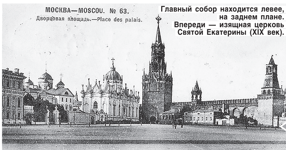
МОСКВА—MOSCOU. № 63. Дворцовая площадь.—Place des palais.

Но на обратном пути командующего корпусом генерал-фельдцейхмейстера (сиречь — армейского обер-артиллериста) Василия Ни-