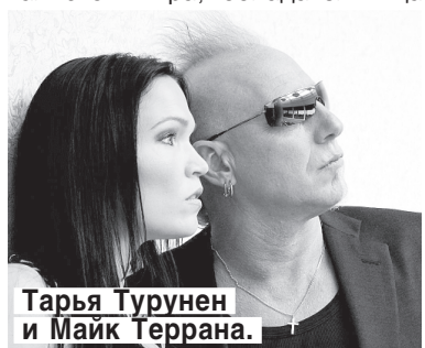
Тарья Турунен и Майк Террана.

20.00 — в ДК «Выборгский» даст концерт с симфоническим оркестром одна из лучших рок-вокалисток мира, обладательница