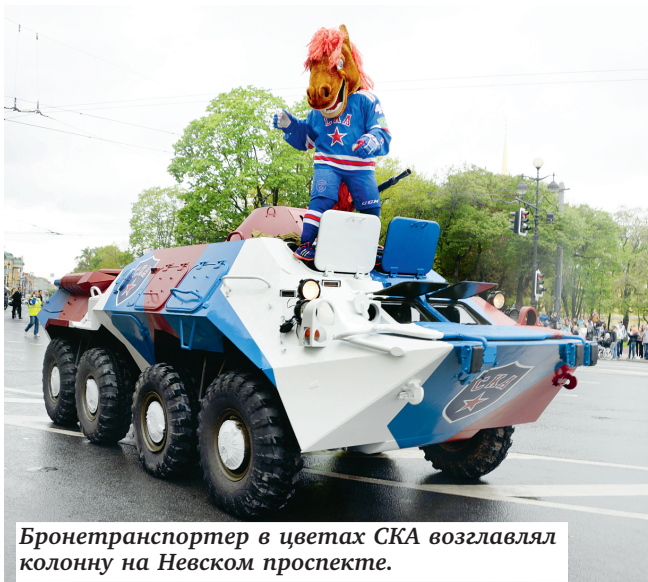
Бронетранспортер в цветах СКА возглавлял колонну на Невском проспекте.