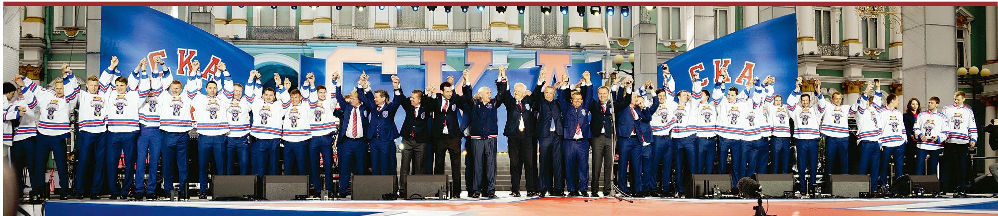
Победителей приветствовали главы Петербурга и Карелии.