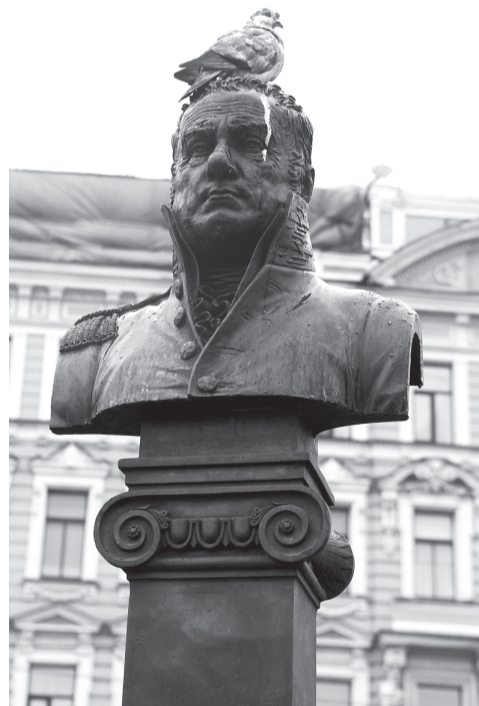
Голубиный помет — очень агрессивная субстанция.

— Но еще больше, чем обычные для Петербурга сырость и дожди, и даже больше, чем недостаточное финансирование, содержат монументы в чистоте мешают самые обычные городские голуби, — поясняют в музее. — Эти птицы спокойно и методично уделывают памятники пометом и при этом чувствуют себя безнаказанными, совершенно не боятся людей. До такой степени, что, когда к памятнику подъезжает вышка, они иногда даже не считают нужным сняться с места!