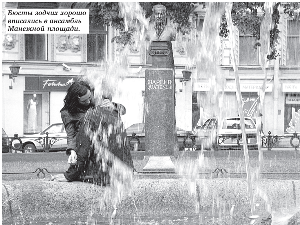
Бюсты зодчих хорошо вписались в ансамбль Манежной площади.