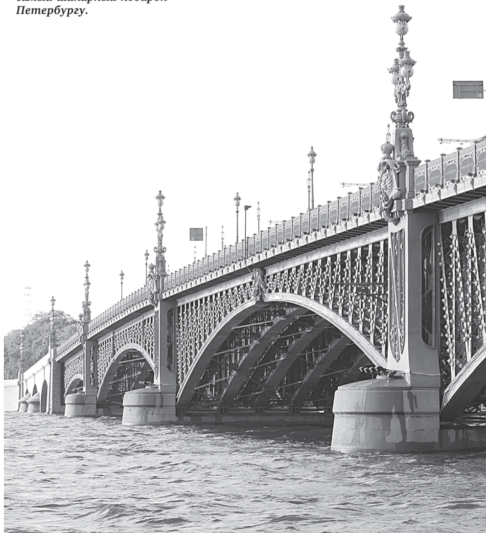
Троицкий мост — пожалуй, самый шикарный подарок Петербургу.

Двухсотлетие было еще круче: августейшая семья Романовых закатила пир на весь мир. Сколько шампанского было выпито — бог весть! По случаю юбилея состоялось грандиозное мероприятие в Летнем саду, а вечером в зале Думы организовали пунш. Но самым грандиозным подарком стал Троицкий мост, который с тех пор празднует свой день рождения вместе со всем городом. Это был третий по счету мост, расположенный рядом с Петропавловской крепостью, который соединял центр Петербурга с Петроградской стороной. Один из красивейших мостов был построен по проекту фирмы «Батиньоль», которая привлекла к его возведению французских специалистов. И мост, заложенный в 1897 году в присутствии русского царя и президента Франции, был открыт к 200-летию юбилею Петербурга, а праздник по этому случаю — с крестным ходом и салютом, включая развод моста императором, — продолжался целый день.