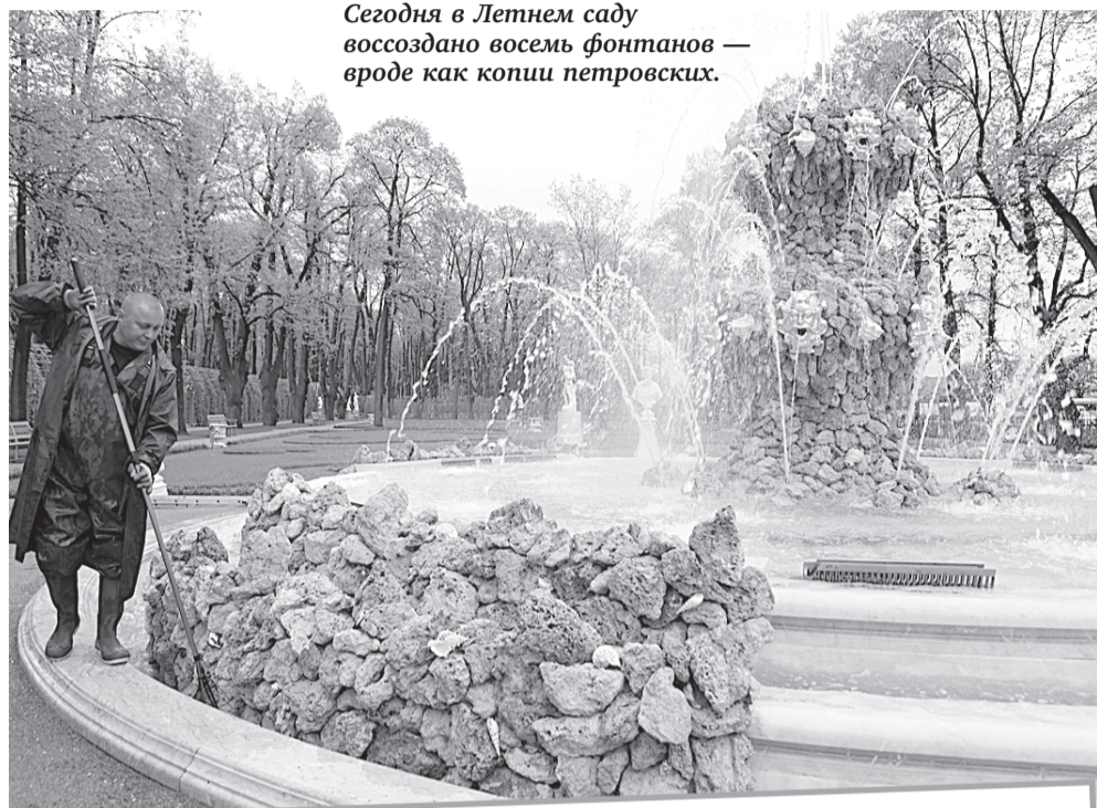
Сегодня в Летнем саду воссоздано восемь фонтанов — вроде как копии петровских.

Все-таки не случайно день рождения Петербурга, который отмечается 27 мая, совпадает с днем рождения его основателя — Петра Первого. Потому Северную столицу всегда можно поздравлять с двойным усердием. И ее поздравляли.