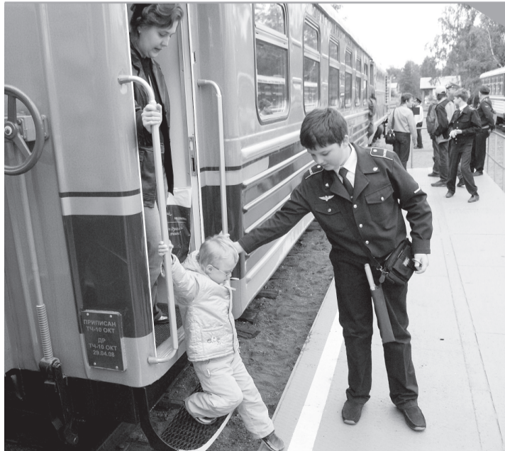
Для пассажиров дорога работает летом, с июня по август, с четверга по воскресенье с 10.30 до 16.00.