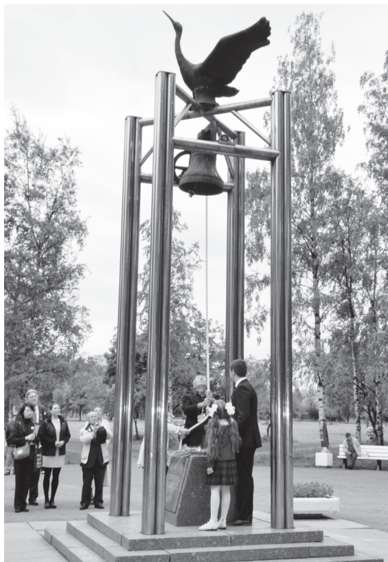
«Колокол мира», который является копией колокола «Ангел», откопанного после взрыва в Нагасаки.

Подготовил Сергей ПРУДНИКОВ