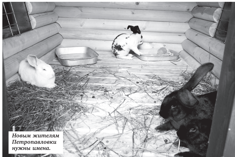
Новым жителям Петропавловки нужны имена.

Все мы знаем эрмитажных котов. Некоторые знают даже петропавловских кошек (и самую известную среди них — Капитолину, живущую в церковном доме при соборе). Теперь вот в городе на Неве появились еще и петропавловские кролики. Новая забава для детей и их родителей. И своеобразная дань уважения названию острова. Хотели зайцев, но была вероятность, что в первый же день хитрые косые сделают подкоп и уйдут из нового пристанища. Поэтому остановились на привычных домашних кроликах.