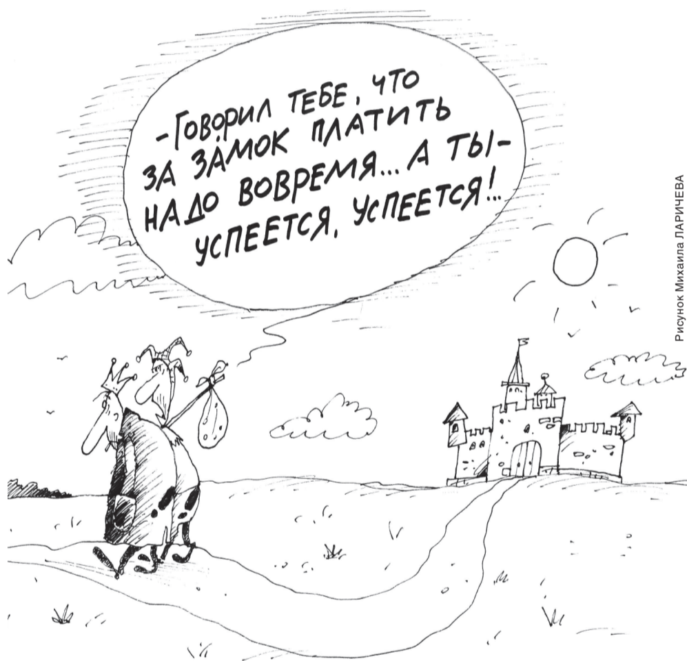
Рисунок Михаила ЛАРИЧЕВА

Одним словом, поставщики коммунальных услуг получили в руки очередные инструменты, позволяющие требовать от потребителей своевременную плату. Вот только у самих потребителей дополнительных возможностей, кроме как жаловаться на некачественную работу коммунальщиков в жилищную инспекцию или в прокуратуру, не появилось. Между тем