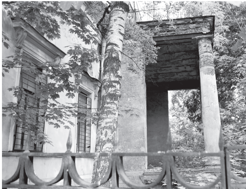
Отделка осыпается, но весь объект пока все же охраняется.

С наступлением летнего сезона окрестное население осваивает уголки парка под пикники с шашлыками. Дымят мангалы, теоретически недалеко и до пожара — но это не на частной, а на арендованной территории. Кто же ее станет охранять: вплоть до 2055 года?