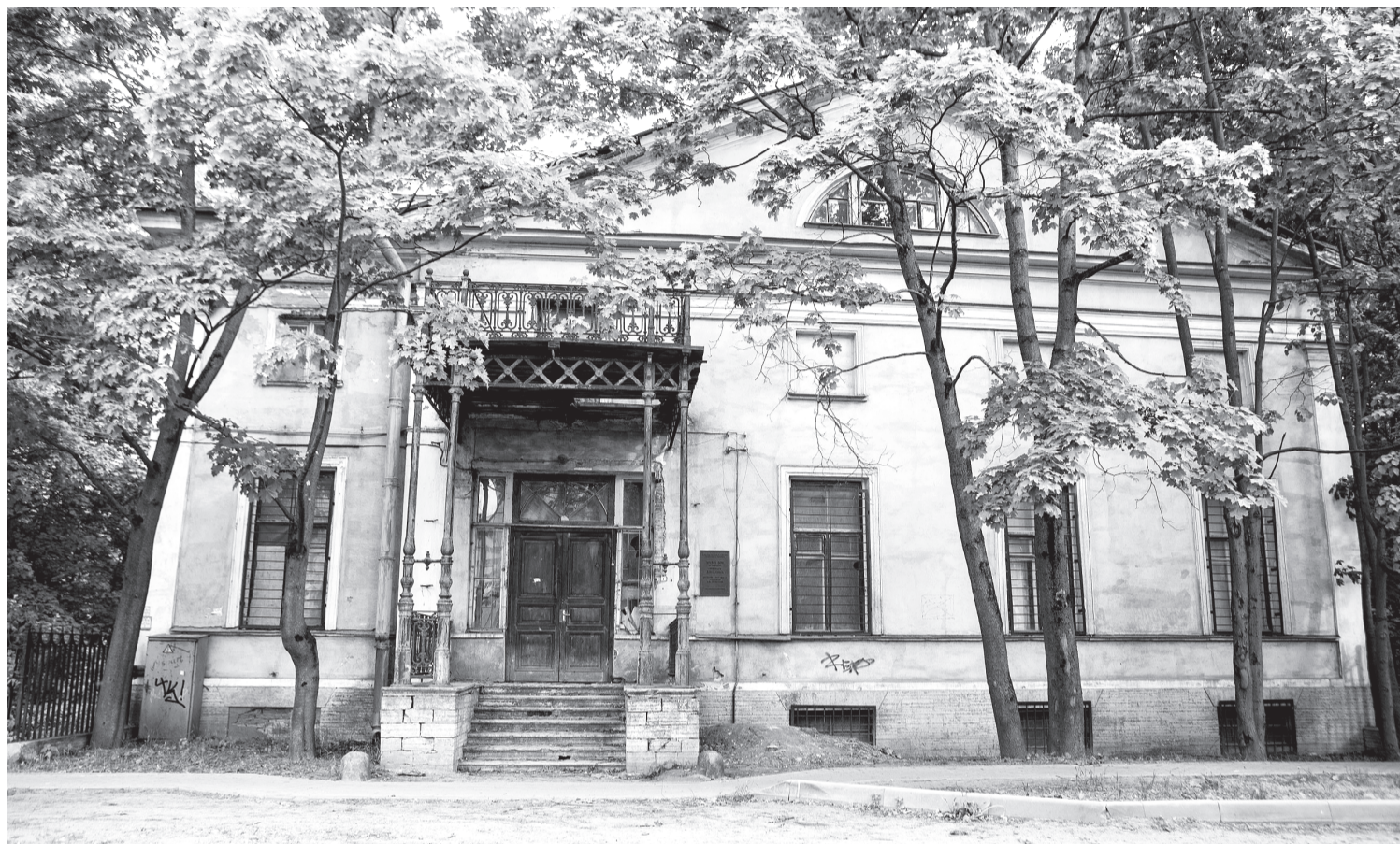
Пока владельцы меняются, историческое здание ветшает.

Коротко с вкладом семейства в военную историю империи можно ознакомиться на его гербе. В нем и сабли, и пушка на лафете, и поверженное турецкое знамя, и крест Святого Иоанна Иерусалимского — Мальтийский крест, а держат щит с регалиями и символами британский лев и вооруженный казак с пикой. Под щитом девиз: «Службою и храбростью». Разумеется, после октября 1917 года вся эта прежняя слава была развеяна, были утрачены титулы, имущество, часть семьи оказалась в эмиграции. Разорение ждало усадьбу Орловых-Денисовых в Коломьягах, в то время дачном пригороде столицы.