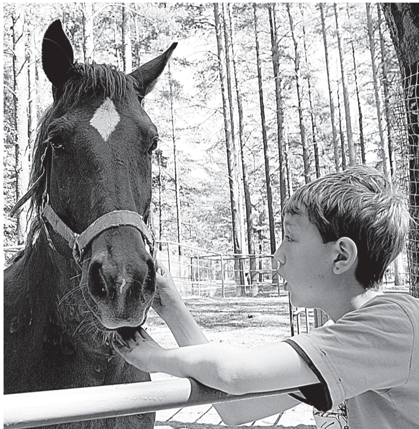
Загородный отдых нужен детям обязательно!

РОСПОТРЕБНАДЗОР ДОПУСТИЛ К РАБОТЕ 164 ЗАГОРОДНЫХ И ГОРОДСКИХ ЛАГЕРЯ ИЗ 203