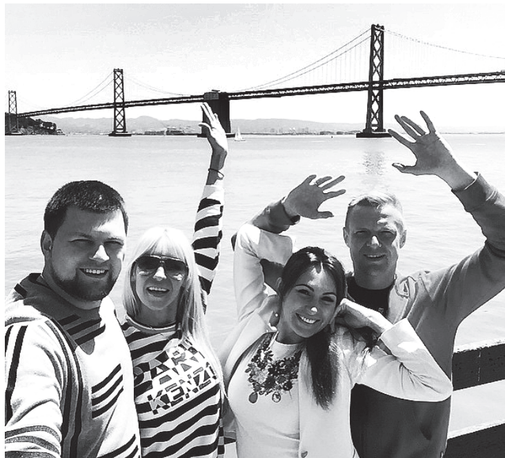
Вячеслав Малафеев (справа) с супругой и друзьями в Калифорнии.

И наконец, Елизавета Туктамышева цветет от счастья — по ее признанию: наша землячка, чемпионка мира по фигурному катанию, стала обладательницей ежегодной премии «Самые знаменитые люди Петербурга-2015». Обойдя при этом игроков «Зенита» и капитана хоккейного СКА