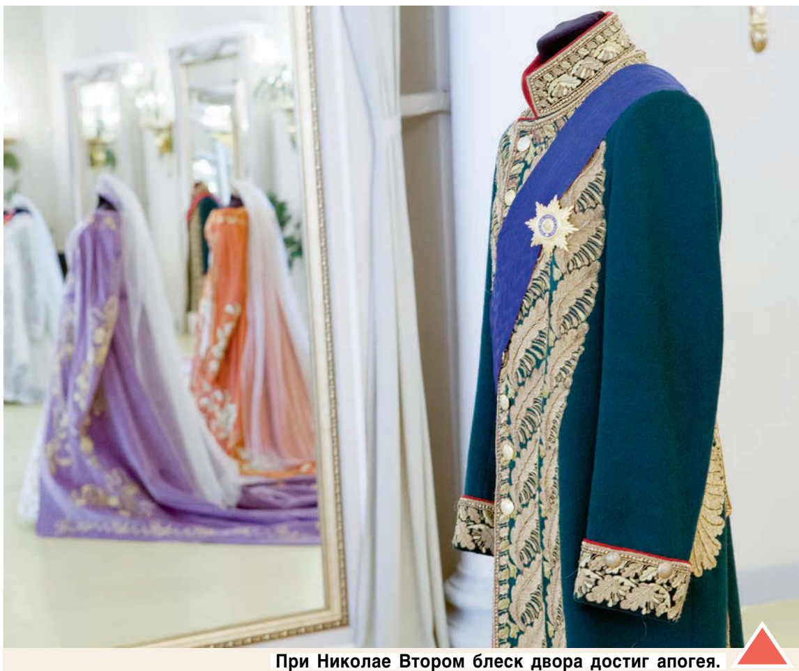
При Николае Втором блеск двора достиг апогея.