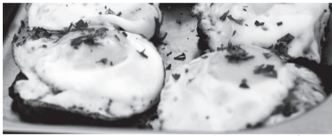
Бифштекс с яйцом.