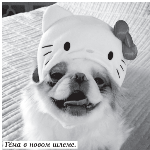
Тёма в новом шлеме.

Перейдем к представительницам синхронного плавания. Вот у кого, в отличие от футболистов, фигуристов (да и теннисистов), нет, казалось бы, на отдых времени — эти спортсмен-