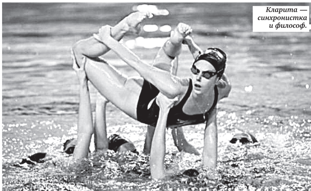
Кларита — синхронистка и философ.

...В очередное путешествие отправился и бывший фигурист, а ныне комментатор Джонни Вейр — небезызвестный русофил, который даже ведет на русском языке в «Твиттере» одну