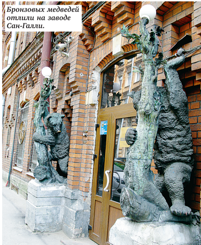
Бронзовых медведей отлили на заводе Сан-Галли.

В истории ЭЧЛ — оснащение часами высоток Москвы и Варшавы, Кремлевского дворца съездов, станций метрополитена страны. Не преувеличим, если скажем, что ленинградские часы были известны всякому жителю СССР. Школьные часы с их резким звонком с урока и на урок были едиными на всю страну и также поставлялись из Ленинграда.