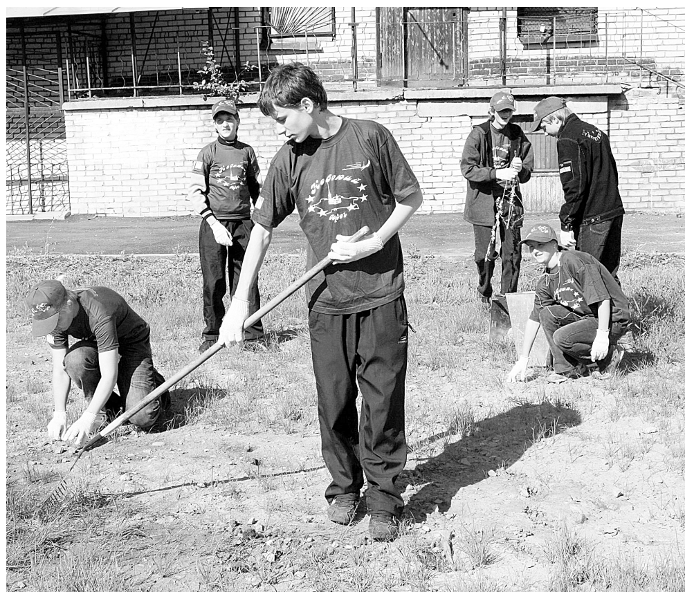
Стать озеленителем — не пожалейте!

Автомойки принимают школьников в качестве мойщиков машин. Разумеется, эта работа больше подходит для мальчиков. Здесь также можно неплохо заработать.