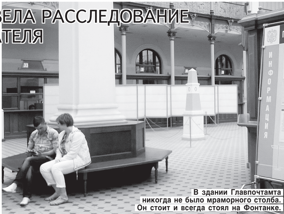
В здании Главпочтамта никогда не было мраморного столба. Он стоит и всегда стоял на Фонтанке.

На дорогах, идущих из Петербурга, верстовые столбы начали устанавливать при Петре I. По велению императора делали их из дерева, красили и подписывали цифрами. Одна верста — один столб, а точкой отсчета расстояния от Петербурга до других населенных пунктов до сих пор считается здание главной городской почты. Здесь находится так называемая нулевая верста. Это знает каждый петербургский школьник. В 1764 году, во время правления Екатерины II, было принято решение заменить деревянные столбы на главных въездах в город каменными. Они были изготовлены в виде обелисков из мрамора и гранита. Сегодня сохранившиеся верстовые столбы тех времен берегут как зеницу ока. Они считаются историческими памятниками. А раз это памятники, разыскиваемый дорожный знак вполне могли отправить в музей. Например, в Музей связи.