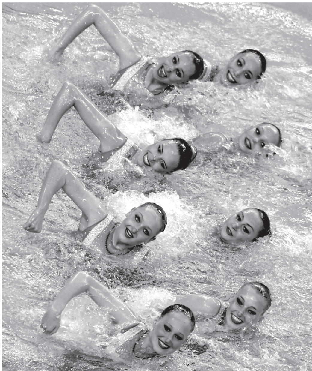
Наши синхронистки — все из молодежной сборной — золотые медалистки первых Европейских игр!

Ну и конечно, опыт, соревновательная практика на высшем уровне, которые не заменишь ничем. Видели бы вы восторг наших синхронисток, которые выиграли в Баку золотые медали в командном турнире! Все девушки — из молодежной сборной, им только предстоит заменить старших на Олимпийских играх. Но тренер российской сборной