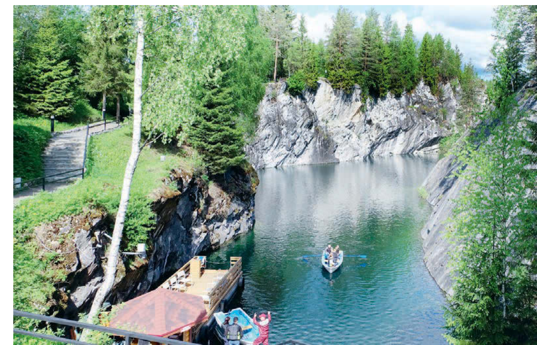
Вид на Главный каньон.