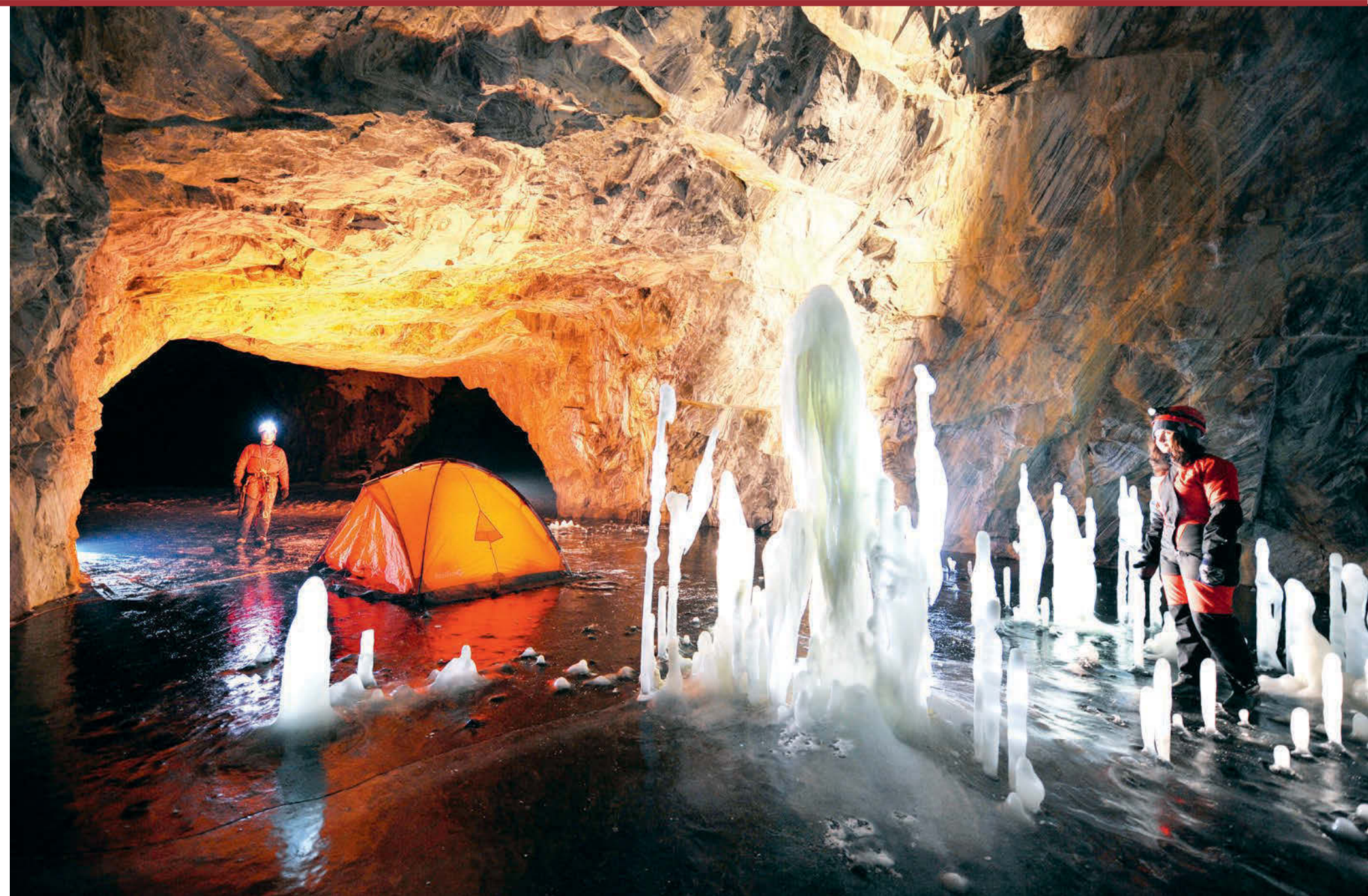
Красоты подземного Мраморного зала скоро станут доступны туристам.

ческая красота из воды и ледяных сталактитов. Внизу — еще два уровня штолен, куда дайверы могут проникать из Главного каньона.