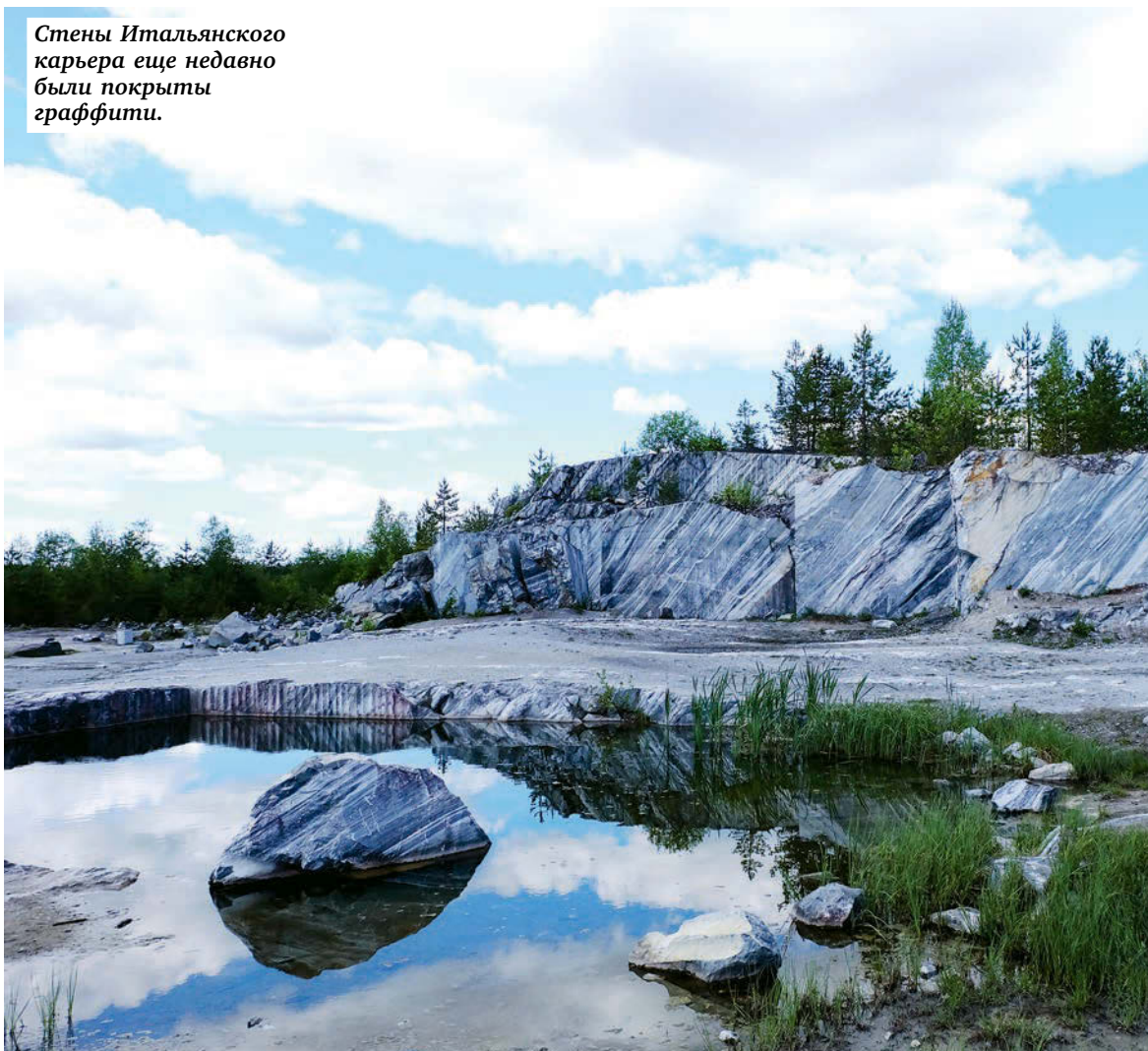
Стены Итальянского карьера еще недавно были покрыты граффити.

Спускаться туда обычным туристам нельзя. Что внизу, можно увидеть только на фотографиях: огромный зал, своды которого поддерживают восемь мраморных колонн — фантасти-