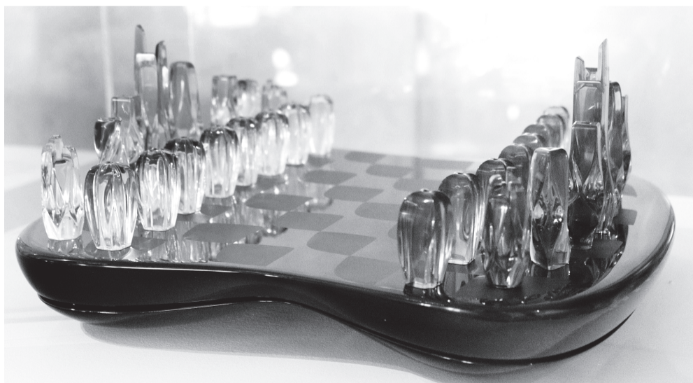
Шахматы «Поле башен». 2014 г.

Например, стол. Он производит впечатление падающего. Но при этом стоит прочно. Или дивной красоты вазы, одна из которых поэтично называется «Расщелина во льду». Или — черные туфли «Пламя».