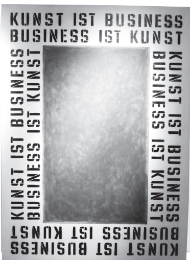
Из серии «Искусство — это бизнес/ Бизнес — это искусство»: живопись (фото слева); книга художника.