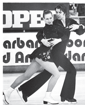
Ирина Моисеева и Андрей Миненков.

120 (1895) — родился Марк РЕЙЗЕН, бас, солист Большого театра, народный артист СССР — и герой Первой мировой: кавалер двух солдатских Георгиевских крестов. Был самым старым — 90 лет — действующим оперным певцом , выступавшим