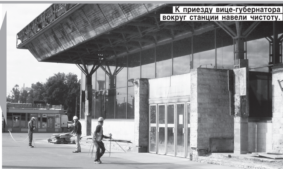
К приезду вице-губернатора вокруг станции навели чистоту.

В ходе ремонта все делается из отечественных деталей и материалов, подчеркнули в Метрополитене.