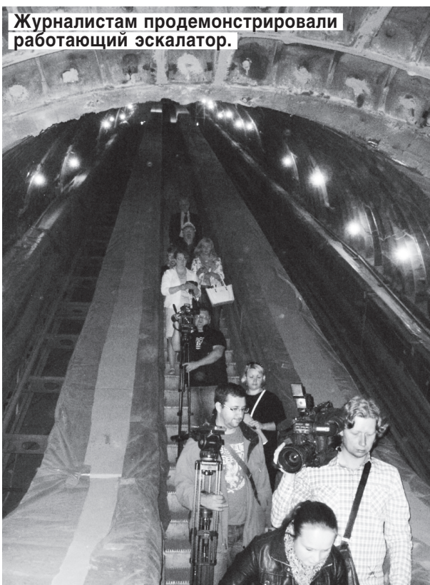
Журналистам продемонстрировали работающий эскалатор.