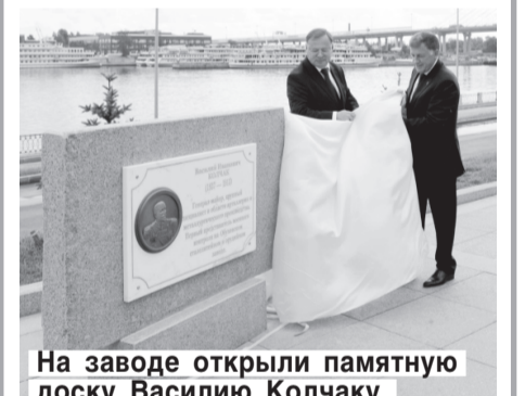
На заводе открыли памятную доску Василию Колчаку.

Торжественным моментом юбилейных событий в честь военного представительства стало и открытие председателем ЗакСа Аллеи Славы на набережной Невы перед центральным входом в новый корпус Обуховского завода. Там увековечили память первого начальника