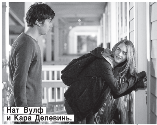
Нат Вулф и Кара Делевинь.