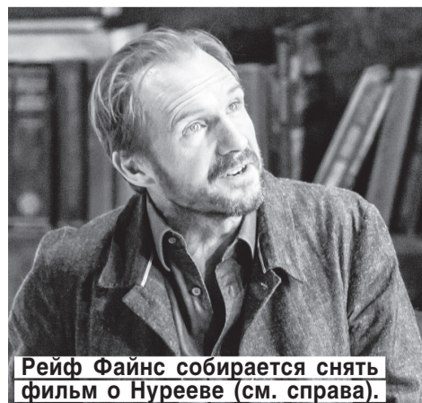
Рейф Файнс собирается снять фильм о Нурееве (см. справа).

меди, обычно в самолетах. Этот фильм с Марком Уолбергом и игрушечным медведем просто превосходный. Я бы хотел сняться в чем-то подобном. («Третий лишний». — Прим. ред.)