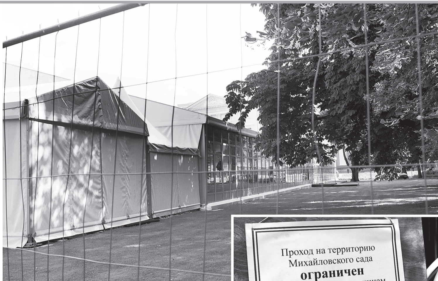
Газоны Михайловского сада восстановят к середине осени.

На борту корабля морскую практику проходят более 300 курсантов.