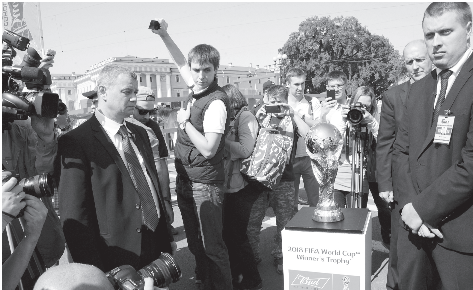
Кубок мира на Дворцовой площади.

Кубок мира по футболу прибыл в Петербург — на один день: трофей, который обретет владельца именно в нашей стране в 2018 году (несколько матчей мундиала состоятся в Северной столице), выставили на Дворцовой площади. Корреспондент «ВП» узнал, каков он, главный приз, который достанется чемпиону.