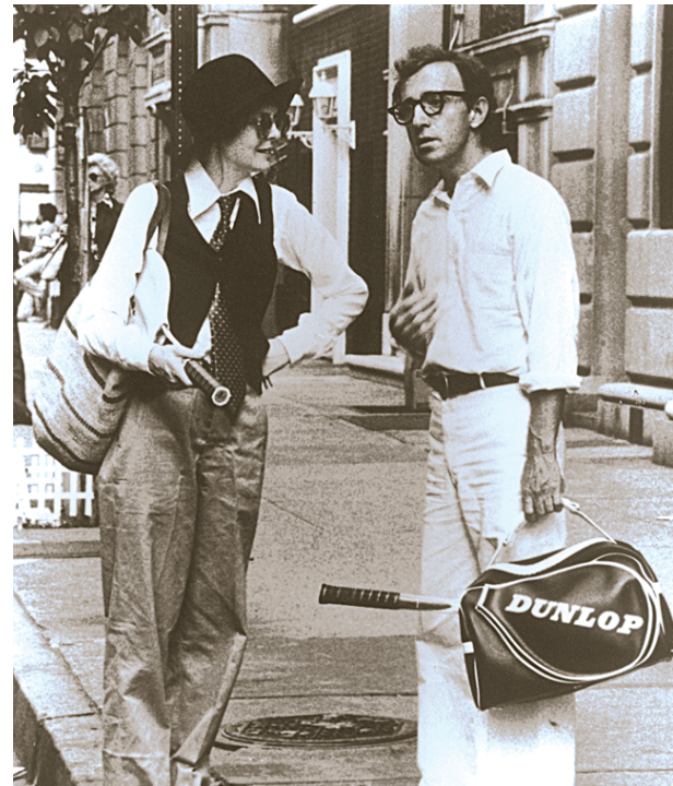
Кадр из фильма «Энни Холл».

Режиссер погиб в 1931 году в автокатастрофе в Санта-Барбаре. Его забальзамированное тело было переправлено в Германию.