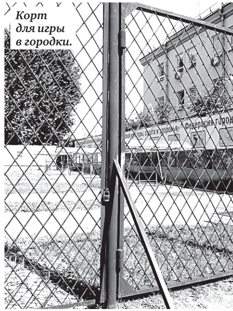
Корт для игры в городки.