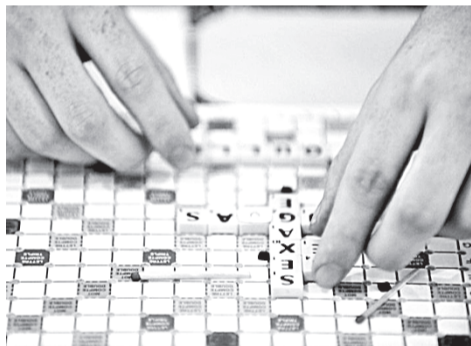
Для чемпионов в скрэббле языковых барьеров не существует!

«Ничего в этом сложного не было, — сказал во время награждения новоиспеченный чемпион. — Я просто выучил все слова из официального словаря французского скрэббла — а все дальнейшее было уж делом техники». Если учесть, что слов этих почти 65 тысяч, а у Ричардса ушло на их запоминание менее двух месяцев, то остается лишь восхититься таким феноменом!