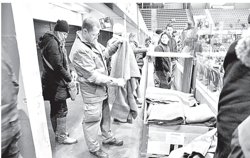
Зрители на «Пост Финанс Арена» разбирают одеяла швейцарской армии.

Швейцарская армия спасает в горах массива Юра от перегрева... коров! Там установилась аномальная жара, за 35 градусов и выше, а буренке, чтобы чувствовать себя хорошо, надо каждый день выпивать не менее 150 литров воды! Вы спросите: при чем тут спорт? Да при том что четыре годами раньше швейцарская армия спасала зрителей чемпионата Европы по фигурному катанию... от переохлаждения!