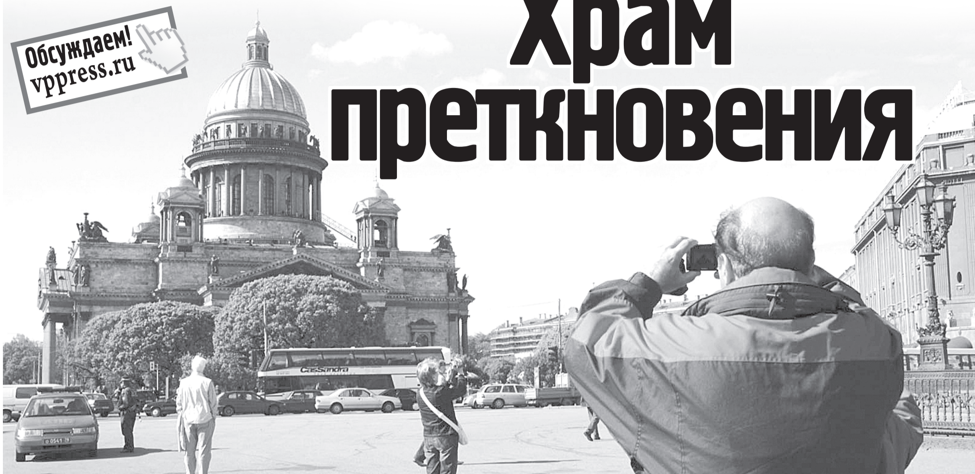
Исаакиевский собор — объект культурного наследия, один из символов Санкт-Петербурга...