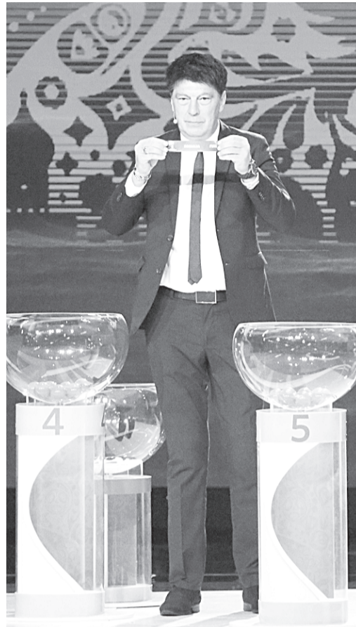
Жеребьевку сборных Африки проводит Ринат Дасаев.

— Пусть сначала подготовятся, пройдут отбор — ведь чтобы сыграть в городе-герое, надо это заслужить, — добавила прыгунья, блистав-