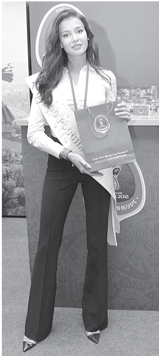
«Мисс Россия-2015» София Никитчук, представляющая свой родной город Екатеринбург.