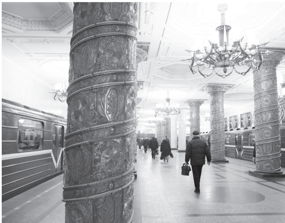
Услышать хорошую музыку всегда приятно. И в метро тоже.

Тем не менее авторы петиции считают, что шансов на победу у них немало. По мнению инициаторов, совсем не обязательно, чтобы классические музыкальные произведения в метро проигрывали постоянно. Они могли бы, например, звучать в перерывах между объявлениями и рекламными блоками, которые приходится слушать людям на эскалаторах. В Петербурге они, как известно, самые длинные в мире, говорится в тексте обращения. Стоять в течение нескольких минут на движущихся лестницах вплотную к незнакомым людям под грохот раздражающих рекламных объявлений — это для любого человека настоящий стресс. Негромкая классическая музыка в такой ситуации «могла бы разрядить психологическую атмосферу, внести релаксационный эффект, а также поспособствовать культур-