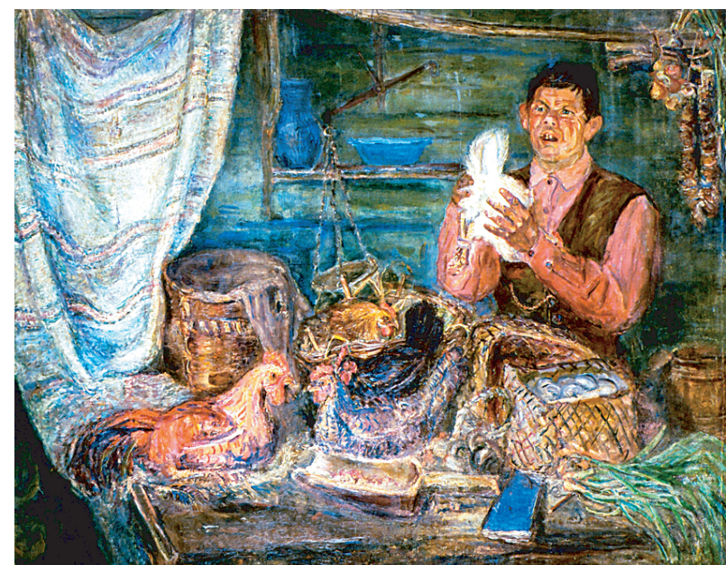
А. Н. Чирков. «Продавец кур (Старый лавочник)». 1935 год. Холст, масло. Поступила: 2006 год, приобретена у Е. Д. Чирковой.

— Такого — не было! Это — как вишенка на торте нашего действительно уникального филоновского собрания.