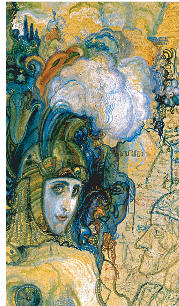
П. Н. Филонов. «Воин». 1909 — 1910 годы. Бумага на картоне, акварель, белла, графитный карандаш. Поступила: 2001 год, дар В. В. Алексеевой.