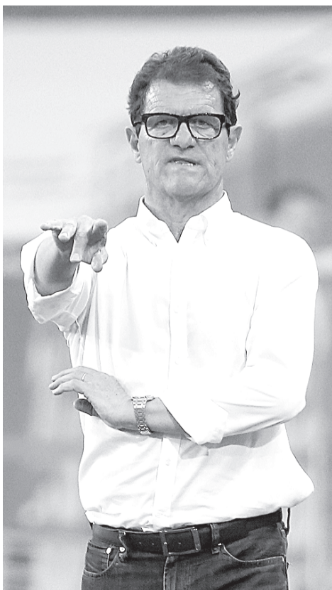
Отставку Фабио Капелло министр назвал обоснованной.

На днях премьер Медведев снял запрет на совмещение постов министра спорта и главы РФС. 56-летний Виталий Мутко будет готовить Россию к Олимпиаде в Рио-де-Жанейро 2016 года и чемпионату мира по футболу 2018 года. «Леги ми фром хай рат» и «Ноу криминалити», как выражается Мутко на международном уровне. Ведь он еще член исполкома ФИФА, председатель оргкомитета «Россия-2018»... Самый спортивный на свете чиновник. А может, и человек.