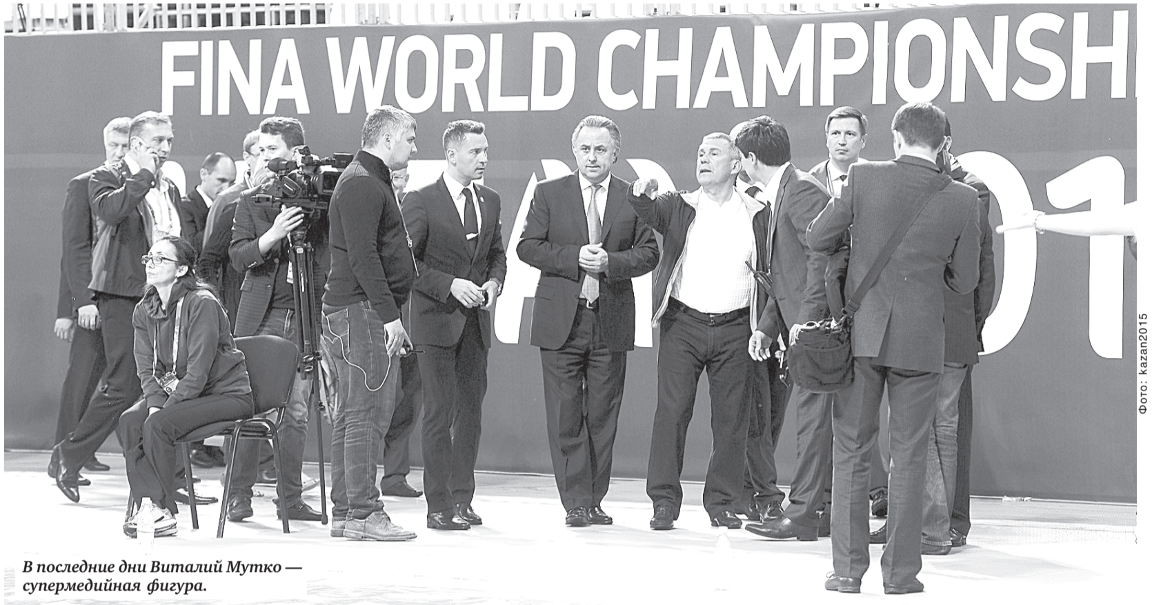
В последние дни Виталий Мутко — супермедийная фигура.