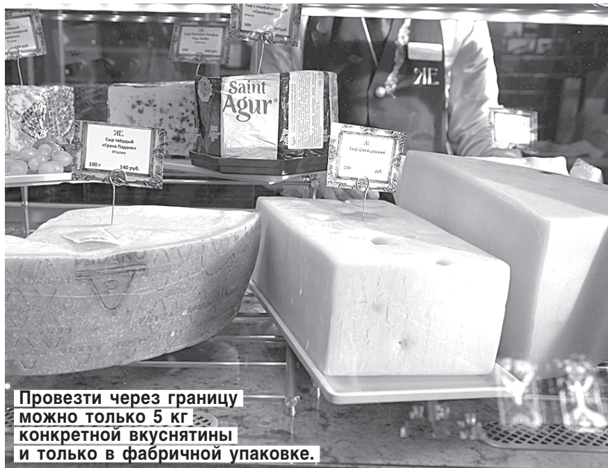
Провезти через границу можно только 5 кг конкретнойкуснятины и только в фабричной упаковке.

Без препятствий пропускают и санкционный сыр в заводской упаковке, колбасы и прочее. 3-килограммовый брусок сыра в эти дни в приграничных районах Южной Финляндии можно купить всего за 12 евро. Для Петербурга цена в 260 рублей за кг хорошего финского сыра — неслыханная дешевизна.