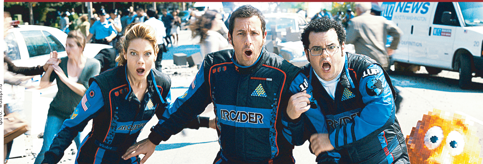
Даже престарелый геймер может найти себя в жизни и спасти мир.