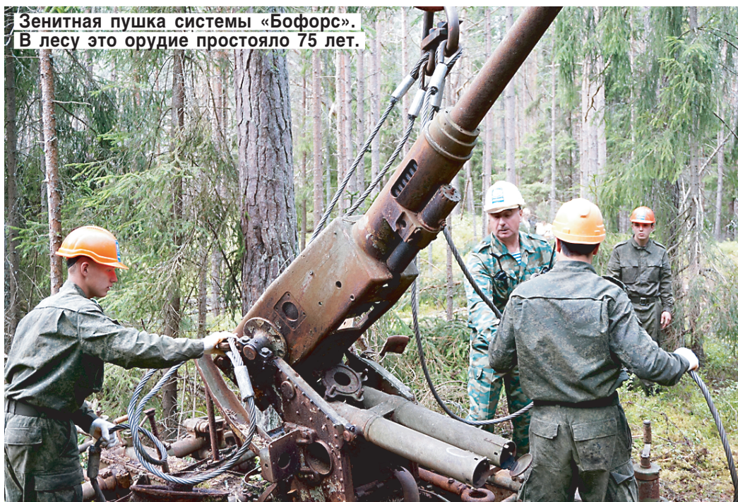
Зенитная пушка системы «Бэфорс». В лесу это орудие простояло 75 лет.

Во время Второй мировой гарнизон немецких войск на Тютерсе составлял 2 тысячи военных: один человек на четыре квадратных метра! И не случайно — вместе с соседним Гогландом и еще парочкой островков поменьше эта гряда играла стратегическую роль — ключа от Финского залива. Кто владел архипелагом — тот контролировал вход в залив. Между островами немцы натянули противолодочные сети, натянули минных цепей. Гогланд контролировали финны, Большой Тютерс — немцы. Наши предпринимали попытки вернуть их, но безуспешно. Оттого и простоял наш Балтийский флот, не всту-