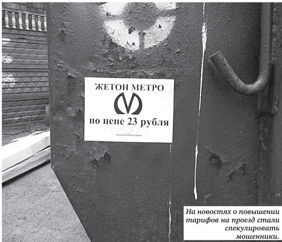
На новостях о повышении тарифов на проезд стали спекулировать мошенники.