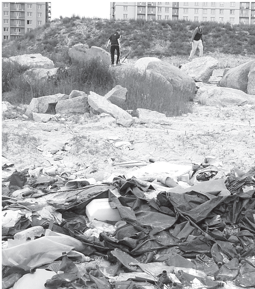
Такую картину наблюдают сегодня из своих окон жители микрорайона.