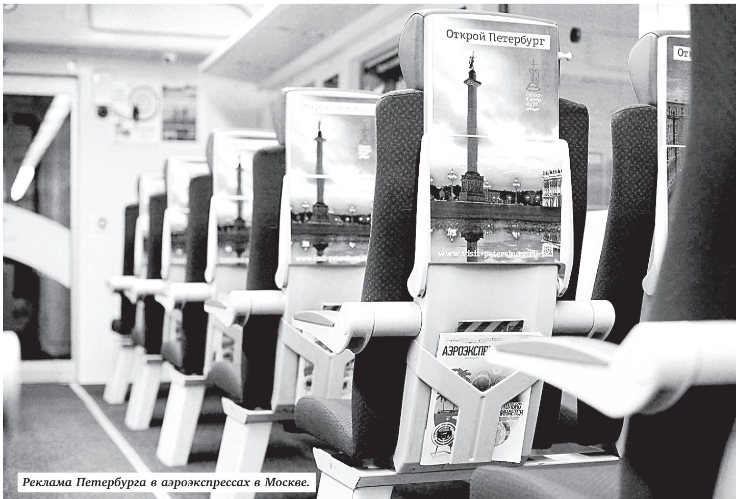
Реклама Петербурга в аэроэкспрессах в Москве.