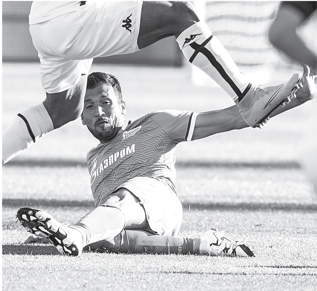
«Зенит» споткнулся на своем поле.

Следующий матч сине-бело-голубые сыграют с казанским «Рубином» 24 августа. Напомним, ранее предполагалось провести эту встречу 23 августа, но пришлось перенести — из-за выступлений «Рубина» в еврокубках.