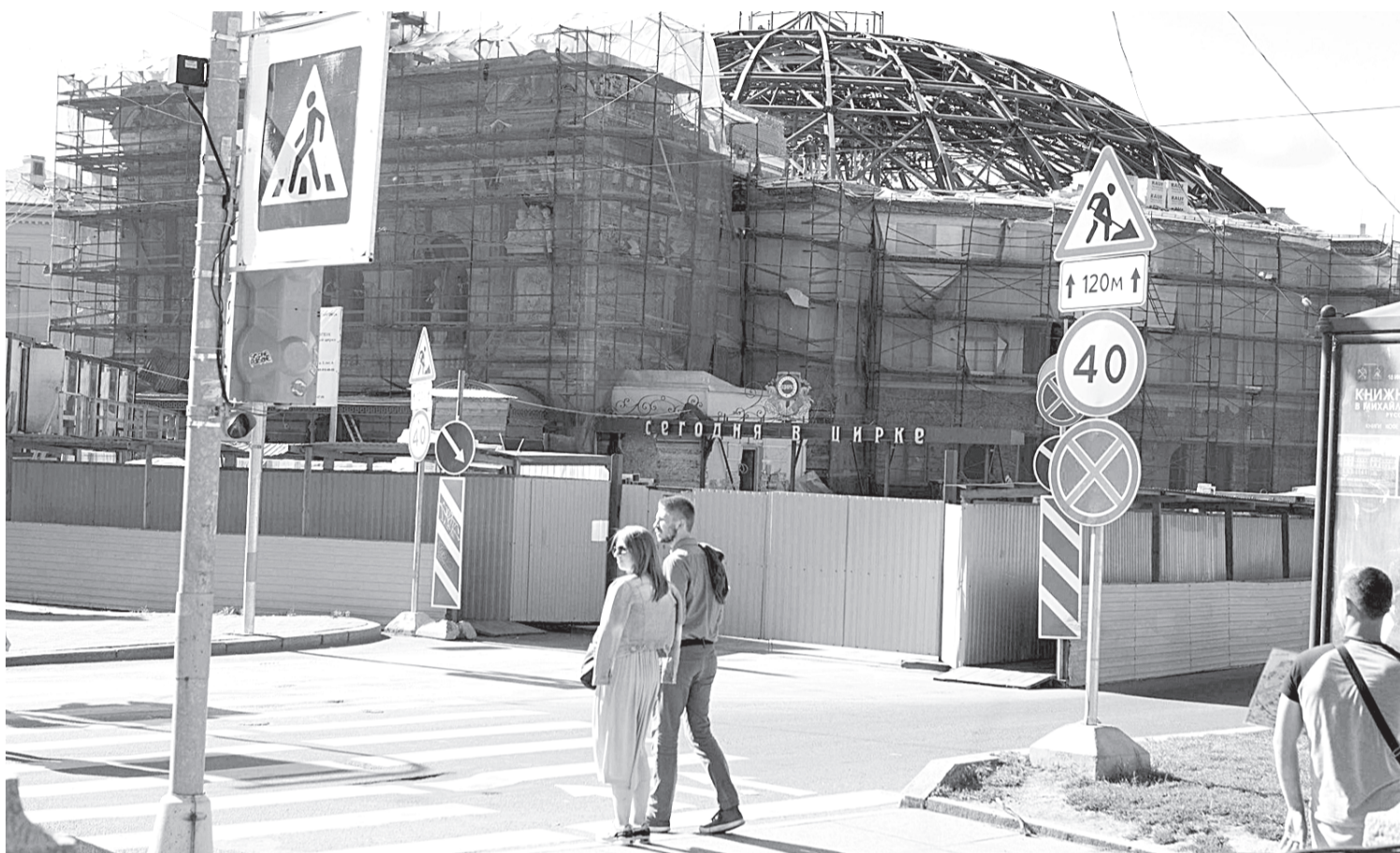
Сейчас железные ребра циркового купола над затянутым в леса зданием напоминают остов выброшенного на берег кита.

ПЕРВОЕ ПРЕДСТАВЛЕНИЕ ОБЕЩАЮТ ПОКАЗАТЬ УЖЕ В ДЕКАБРЕ