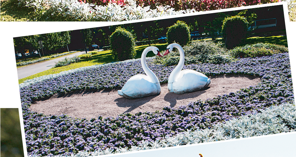
Лебеди украшают сад у загса на улице Демьяна Бедного.