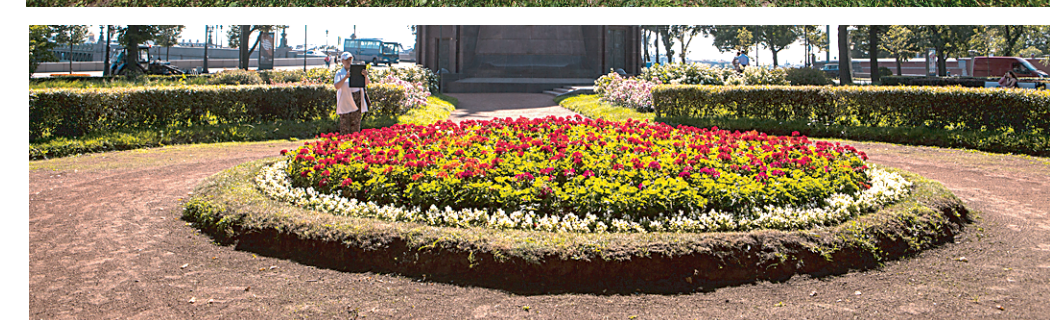
На фоне клумбы у часовни Троицы Живоначальной любят фотографироваться туристы.