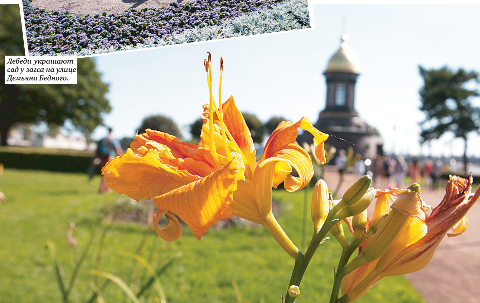
Один из участников конкурса — сквер на Троицкой площади.