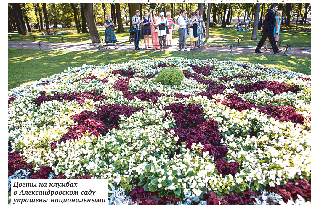
Цветы на клумбах в Александровском саду украшены национальными орнаментами стран — участниц Конгресса ландшафтных архитекторов.