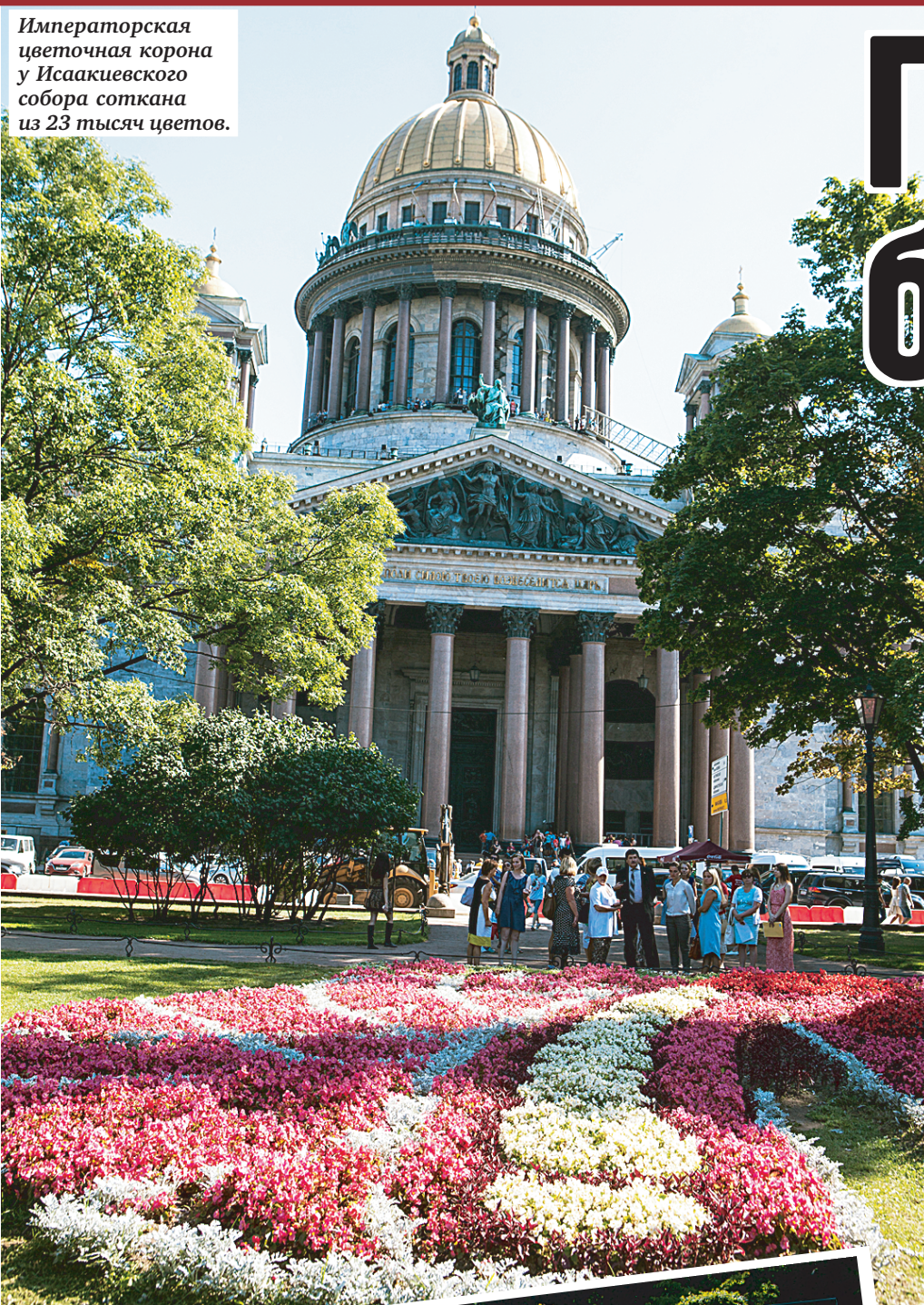
Императорская цветочная корона у Исаакиевского собора соткана из 23 тысяч цветов.