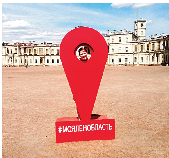
Лучшее место для фотосъемки у Гатчинского дворца — здесь!

Уже действующие фотозоны можно найти: 1. В Гатчинском дворце (Гатчина). 2. В родовом имении Строгановых-Голицыных — усадьбе Марьино (Тосненский р-н, дер. Андрианово). 3. В музее «Дом станционного смотрителя» (Гатчинский район, деревня Выра). 4. В Саблинских пещерах (Тосненский р-н, пос. Ульяновка). 5. В парке-заповеднике «Монрепо» (Выборг).