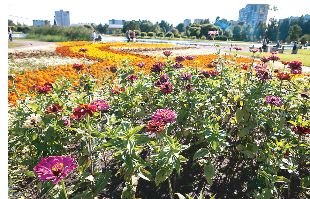
Сад цветов на проспекте Просвещения удивляет яркими красками.