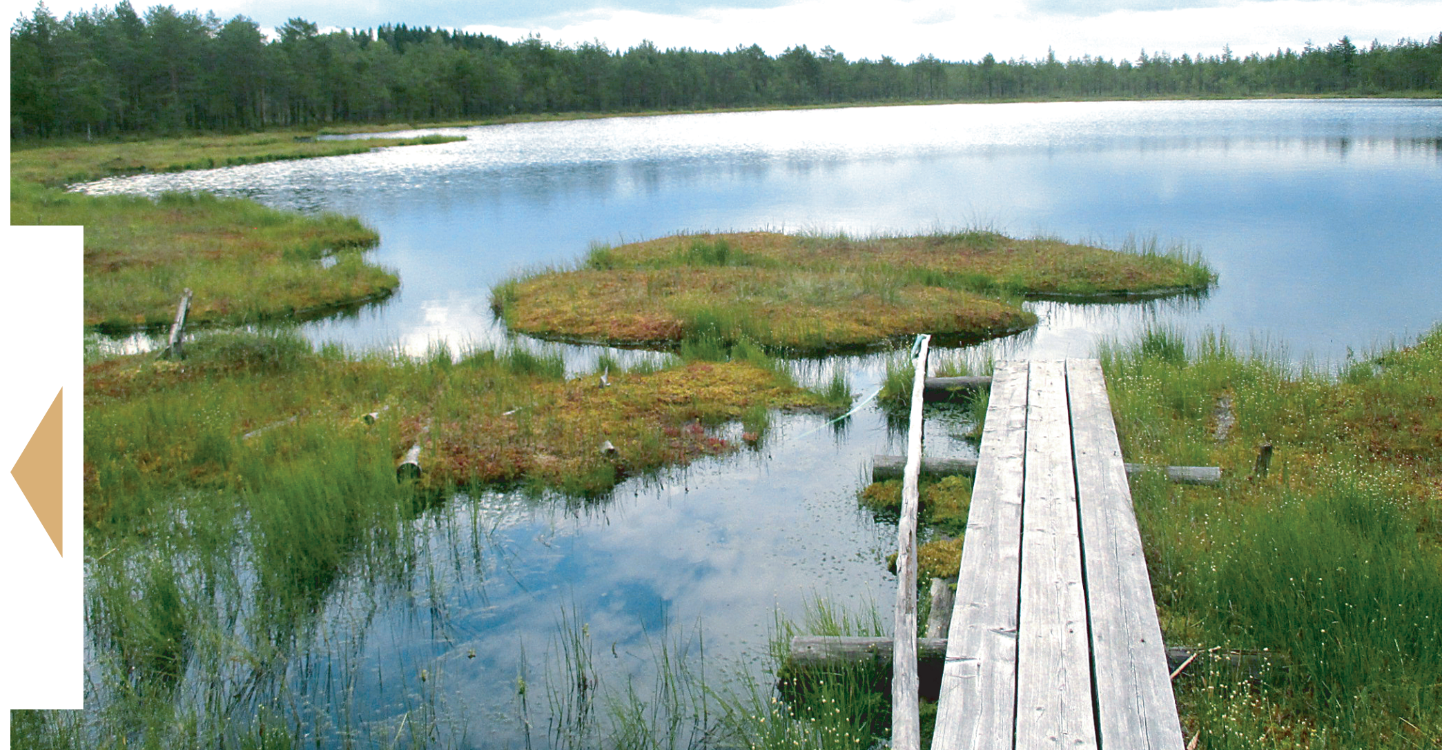
На так называемом Питвеевом озере плавающие островки, хоть и не такие зеленые, сохранились. Пока сохранились. Но и сюда норовят пробраться отдыхающие.

В этом году в связи с дождливой погодой болото делает много «вдохов», то есть его уровень повышается. «Выдох» для болота — когда осадков нет и уровень снижается.