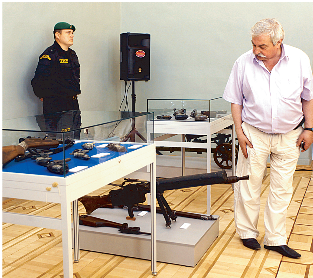
Суходом из музеев полицейской охраны расходы на безопасность учреждений возрастут в разы.