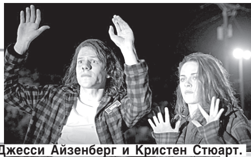
Джесси Айзенберг и Кристен Стюарт.