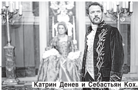
Катрин Денев и Себастьян Кох.