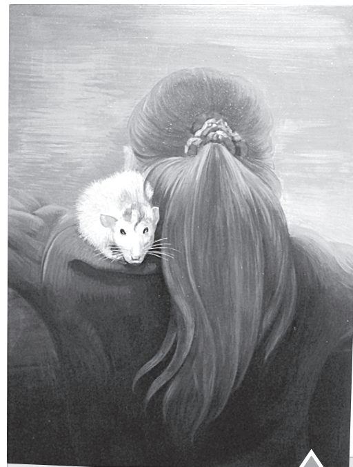
«Щи зеленые с яйцом».

Вторая часть экспозиции состоит из серии работ, которые так и называются — «Cosa Mentale». Тут как раз прямая отсылка к вечности: картины изображают небо, иногда в сочетании с водой, иногда с песком,